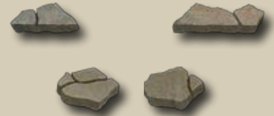
Základný prvok dlažby